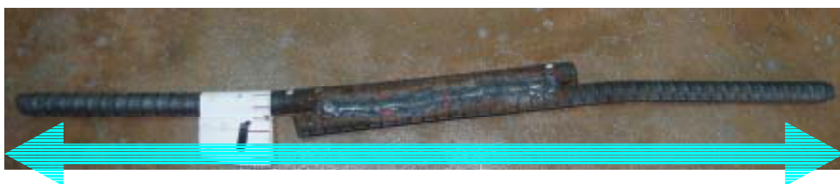
軸が一致している例